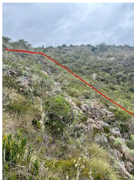
GRÁFICO 1. ZONAS ESTRATÉGICAS PARA LA CONSERVACIÓN Y PROTECCIÓN DEL RECURSO HÍDRICO

La actividad por ejecutar es el aislamiento de predios de interés hídrico de propiedad del municipio de Tocancipá, adquiridos de conformidad a lo dispuesto en la ley 99 de 1993, lo que conlleva el transporte de insumos, demarcación de áreas, instalación de postes de concreto, instalación y tensado de alambre de púas.